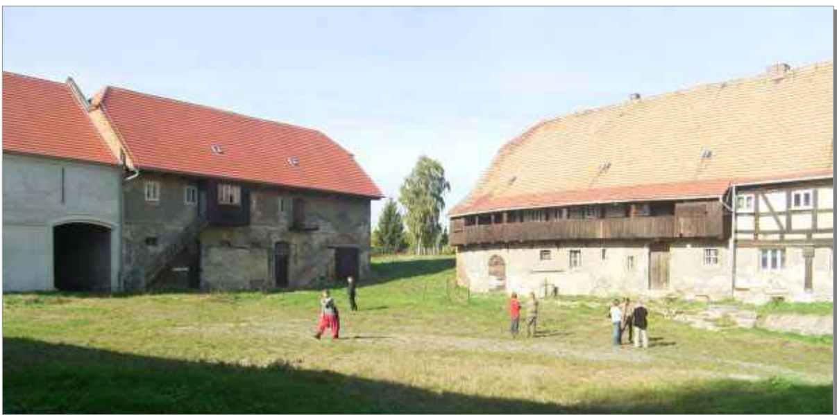
Niederhof in Görlitz, Herbst 2005

Eines der letzten erhaltenen Görlitzer Hofgüter, welches keine Aussichten auf „Rückkehr in die Landwirtschaft“ hat, dient uns mit seinen zwei großen Bauernhäusern und geräumigem Nebengebäude mit insgesamt 1600 m 2 Nutzfläche als Ausgangspunkt unserer Arbeit.